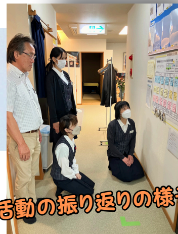
活動の振り返りの様子